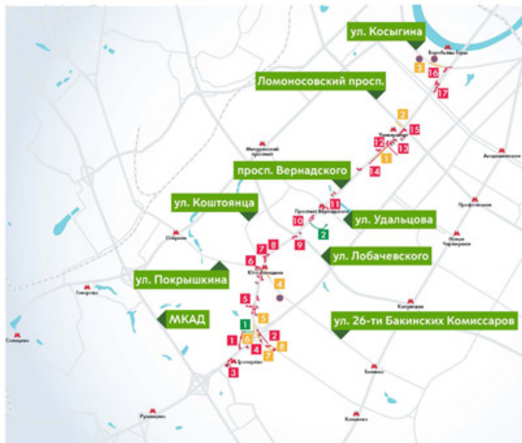
Схема организации дорожного движения закрытия участка Сокольнической ли